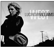
Die gute Amerikanerin

POLITIK: In Den Haag wird für heute Abend das Urteil des Internationalen Gerichtshofs zum serbischen Völkermord während des Krieges auf dem Balkan erwartet. Es wäre das erste Mal, dass ein ganzer Staat für ein solches Verbrechen haftbar gemacht wird. In München gibt am Dienstag McDonald's seine Jahrespressekonferenz, auf der sich der nicht unumstrittene Konzern (siehe u. a. auch „Fast Food Nation“) mal wieder als lukullischer Segen der Menschheit präsentieren wird. Und in Berlin treffen sich am Mittwoch die Kulturminister der Länder, um die Leistungsfähigkeit des deutschen Bildungswesens im internationalen Vergleich schönzureden. KINO: Am Donnerstag läuft mit „Junebug“ eine gefeierte Tragikomödie über die Spaltung der USA in „rote“ und „blaue“ Staaten an. MUSIK: Am Freitag kommt es Schlag auf Schlag, mit neuen Platten von Arcade Fire („Neon Bible“), Bryan Ferry („Dylanesque“), Herbert Grönemeyer („12“), Lucinda Williams („West“) und last but not least DJ Ötzi („Sternstunden“). Apropos Sternstunden: Das neue Bright-Eyes-Album, „Cassadaga“, ist, so viel sei hier schon mal verraten, besser als alle alten Platten und die von Arcade Fire zusammen, erscheint offiziell aber erst im April. Ättsch!